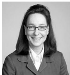
Sabine Alexandra Schmitz